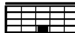
ZŠ Dr. J. Malíka, Chrudim

Od září 2011 bylo do projektu zapojeno dalších 12 základních škol. Učitelé těchto škol ověřovali učební jednotky vytvořené na šesti laboratorních školách.