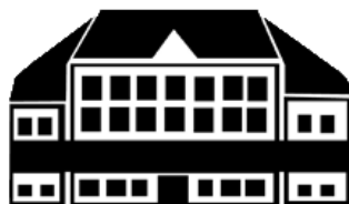
ZŠ, MŠ, ZUŠ Jesenice