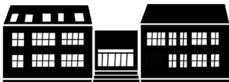
ZŠ Vrané nad Vltavou