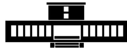
ZŠ a MŠ Dobronín